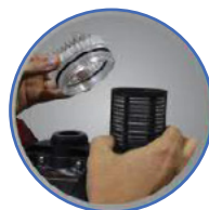
Ενσωματωμένο σύστημα φιλτραρίσματος Integrated filtration system