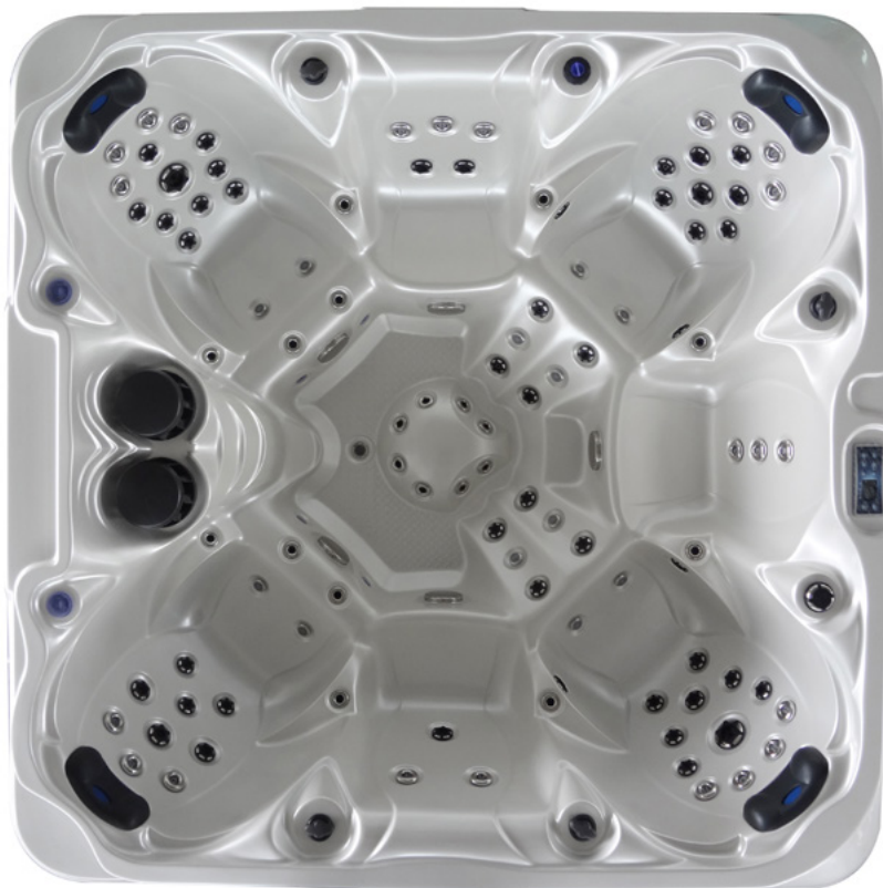
Colours: Shell H-01