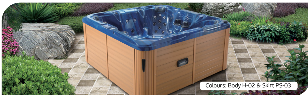
Colours: Body H-02 &amp; Skirt PS-03