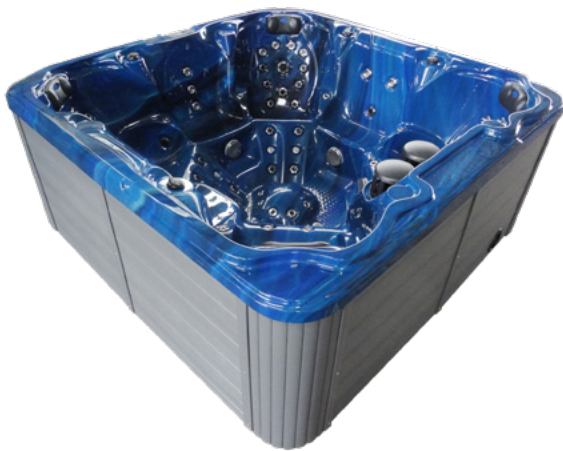
Colours: Body H-02 & Skirt PS-02