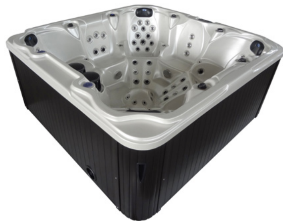
Colours: Body H-01 & Skirt PS-04