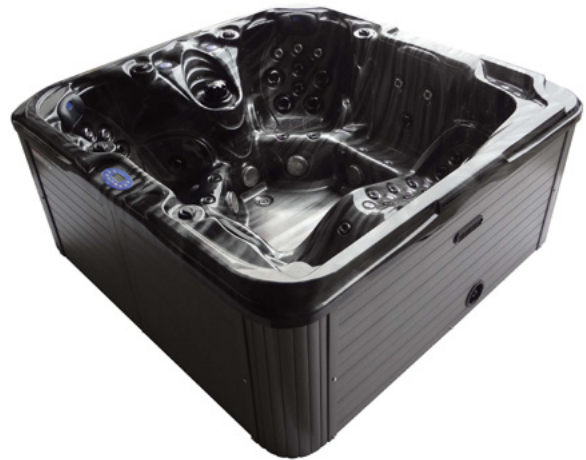
Colours: Body H-03 & Skirt PS-02