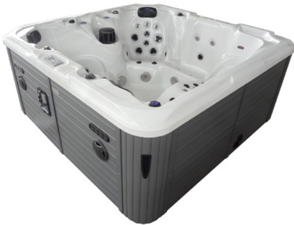
Colours: Body H-06 & Skirt PS-02