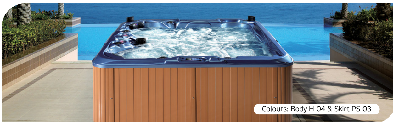
Colours: Body H-04 & Skirt PS-03