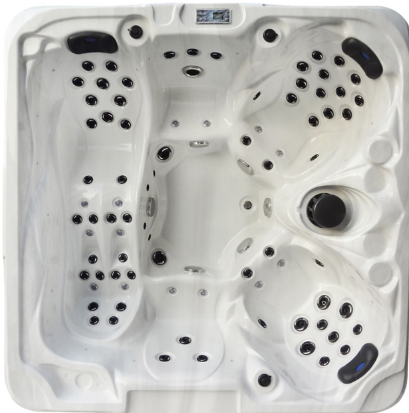
Colours: Shell H-06