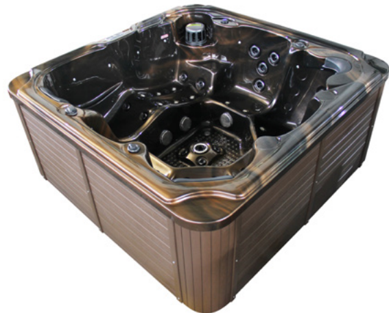
Colours: Body H-13 & Skirt PS-01