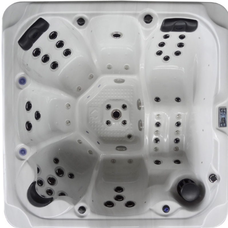
Colours: Shell H-06