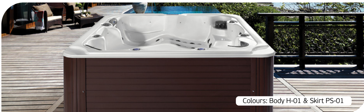
Colours: Body H-01 &amp; Skirt PS-01