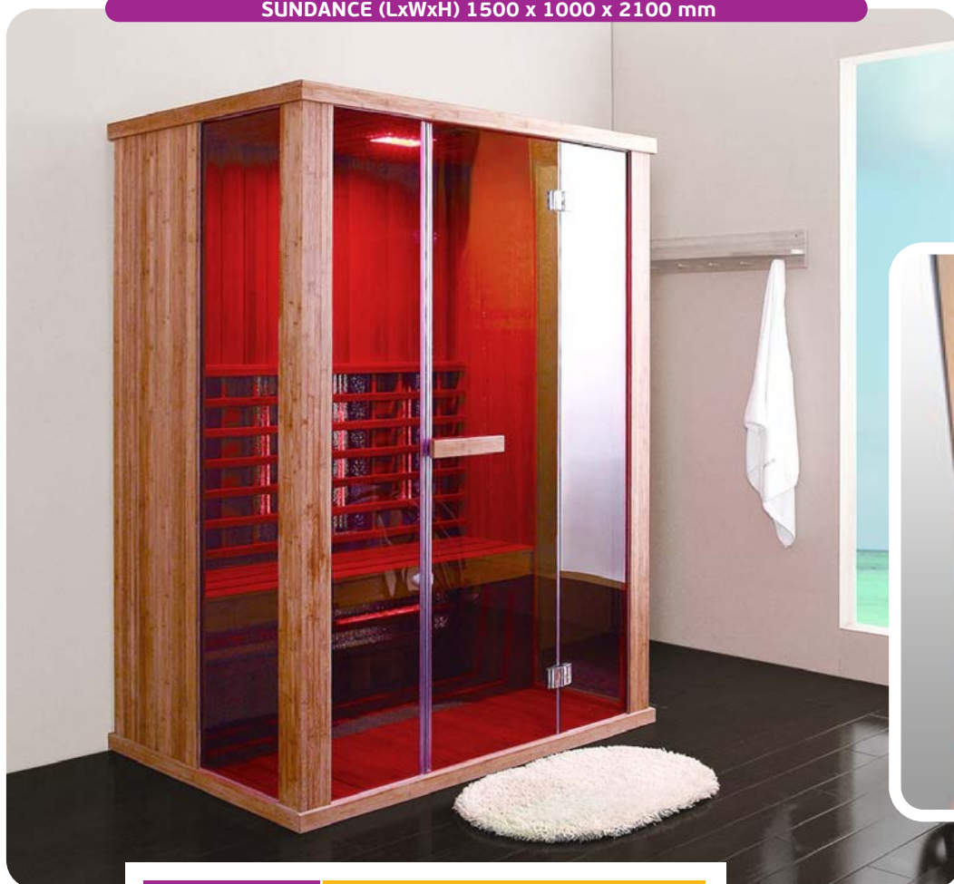
SUNDANCE (LxWxH) 1500 x 1000 x 2100 mm