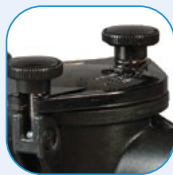
Διάφανο καπάκι See-through strainer cover