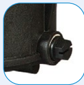
Τάπες αποστράγγισης για εύκολη χειμερινή συντήρηση Drain plugs for an easy wintering