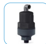
Βαλβίδα εξαέρωσης Air relief valve