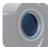
Θυρίδα επίβλεψης Sight glass