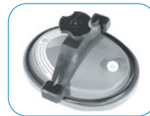
Ανθρωποθυρίδα οροφής Top manhole