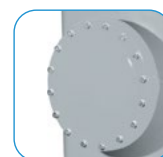
Στρογγυλή ανθρωποθυρίδα Round manhole