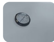
Μανόμετρο Pressure gauge