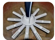
Σύστημα κολλέκτορα με diffuser Arm collectors